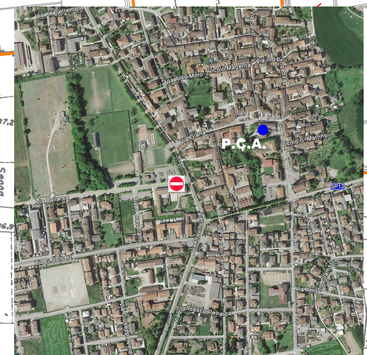
1: VIA VALLARSA, INTERSEZIONE CON VIA MARCONI POSTO COMANDO AVANZATO PRESSO SEDE COMUNALE