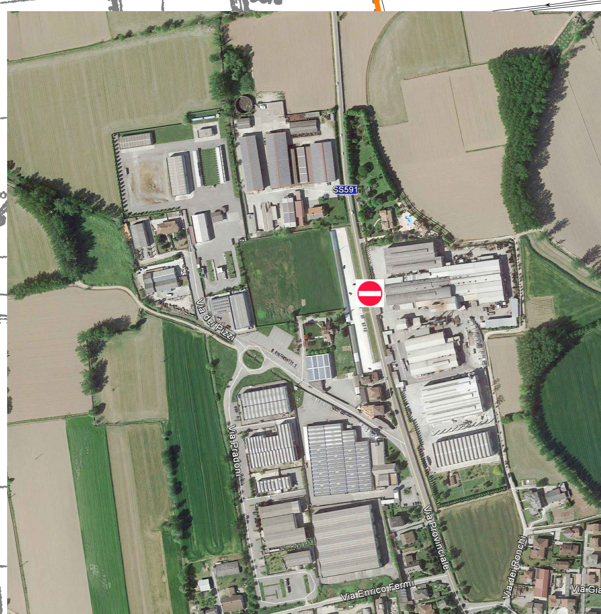
3: VIA MARCONI, EX SS591, ALTEZZA DITTA "FONDINOX"